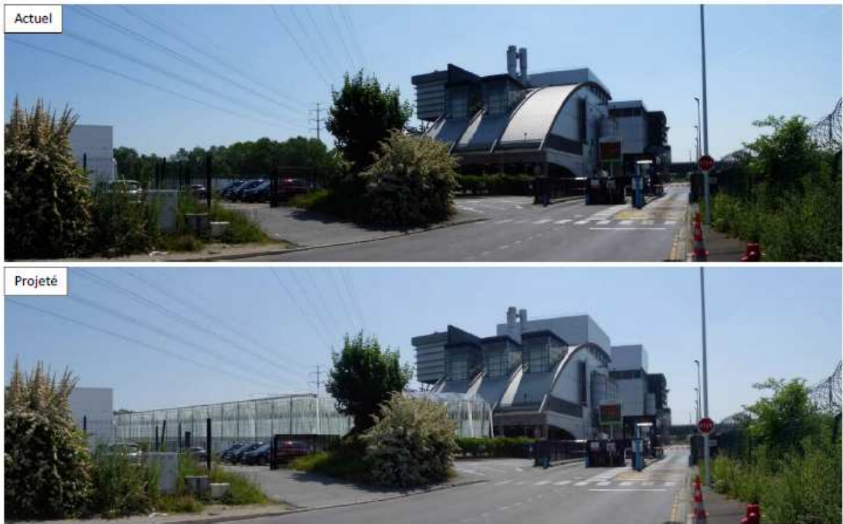
Fig.1 : Intégration paysagère de l'usine avant/après le projet