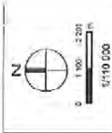
Carte 8 : Bassins dont les eaux de ruissellement alimentent La Bièvre