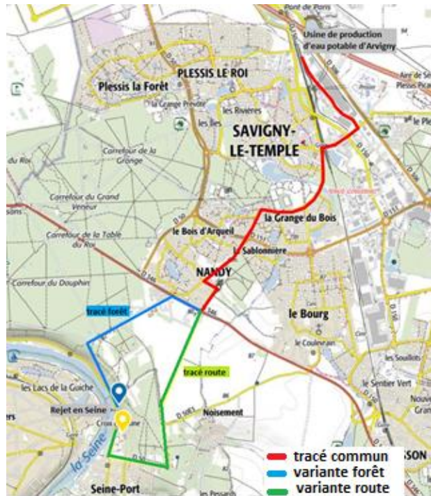
Figure 2 : Projet - opération usine et opération exutoire de rejet