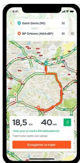
Calcul des temps de parcours