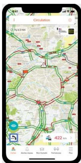
Trafic, travaux, et événements en temps réel en Île-de-France